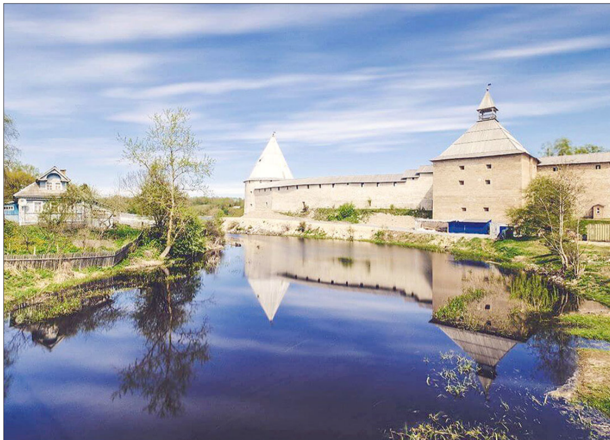
Старая Ладога. Староладожская крепость

Тысячу лет назад Ладога являла собой экономически процветающий город-порт. Основой ее процветания стала посредническая торговля. Ладожский порт служил перевалочным пунктом, через который проходили драгоценные северные меха, оружие, ткани, утварь и другие товары. Здесь найдены арабские серебряные дирхемы – основная валюта конца I тысячелетия; археологи обнаружили средиземноморские бусы и скандинавские застежки,