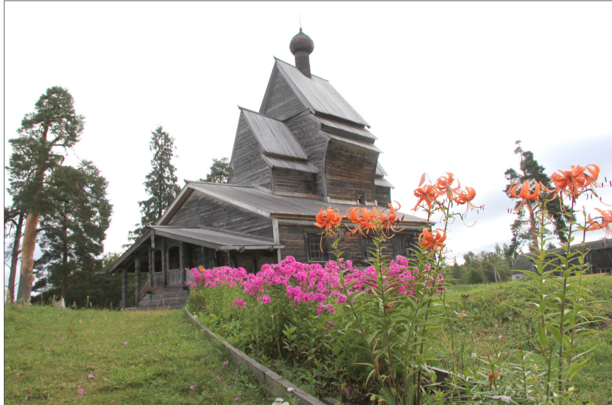
Георгиевская церковь, д. Родионово

В небе над Прибалтикой и Карельским перешейком Герой Советского Союза В. Г. Серов сбил 44 вражеских самолета. В честь героя, погибшего смертью хра-